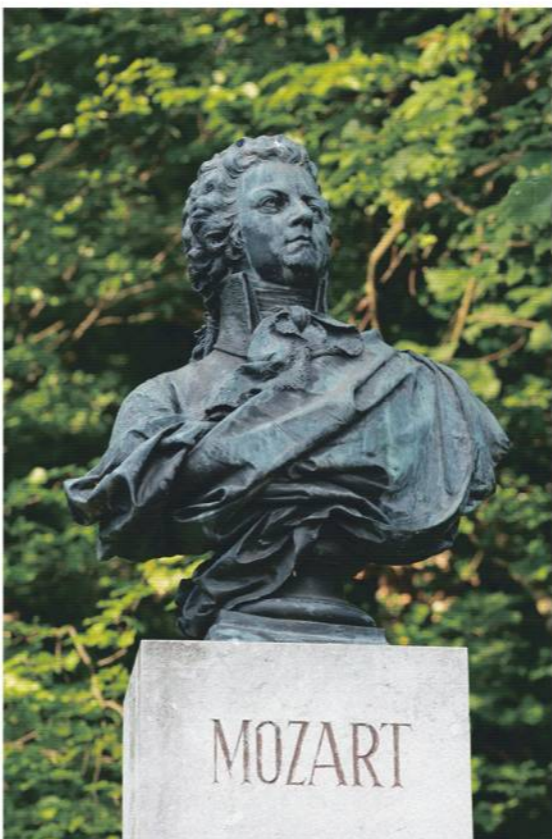
市内には胸像などモーツァルトに関連するものが多く残る

かつて住居だった建物を再建した博物館で地下に保管してある手紙や楽譜などの一部を見せてもらった。分厚い金属扉を開けるとひんやりとした小部屋が広がる。温度は19〜20度、湿度は44%に保たれている。直筆の楽譜が約100点、手紙は約600通のうち半分がモーツァルト直筆という。一番古い楽譜は5歳ごろに作曲したものだそう。父親が代筆した可能性が指摘されているほど丁寧に書かれた五線や音符に、神童ぶりの一端がうかがえた。