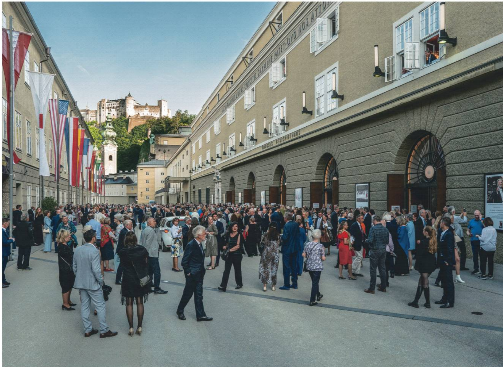
聖霊降臨祭音楽祭の最後を飾るテノール歌手、ブラシド・ドミンゴのコンサートのため祝祭大劇場(右手の建物)に集まった聴衆ら(ザルツブルク市)

ザルツブルク旧市街にある祝祭大劇場の前は着飾った淑女、紳士の社交場と化していた。高級車が人波を縫うように到着すると談笑の輪が広がり、その脇を観光客を乗せた馬車が走り抜ける。見上げると、11世紀から街のシンボルであるホーエンザルツブルク要塞(城)が浮かび上がる。時代が交錯したかのような不思議な風景だ。