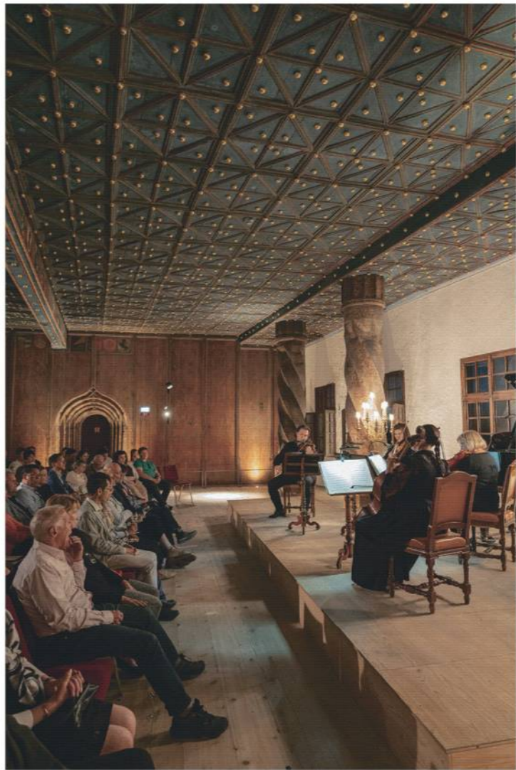
ホーエンザルツブルク要塞で開催された演奏会。市内では年間4500回もの演奏会が開かれる

そんな劇場が並ぶ旧市街には要塞の下に約20の教会のほか、修道院、宮殿などの歴史的建造物がひしめく。様式もロマネスク、ゴシック、ルネサンス、バロックなど様々だ。ユネスコの世界遺産にも登録されているザルツブルクの旧市街は、18〜19世紀のドイツ人博物学者で探検家のフンボルトが「ナポリ、コンスタンティノール(現イスタンブール)と並んで世界で最も美しい街」と称したといわれている。